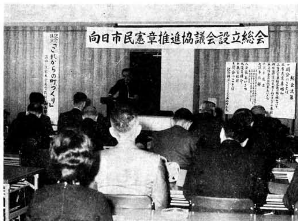
住みよいまちづくりへ向日市民憲章推進協議会が発足

市民憲章を合言葉に明るく住みよいまちづくりを市が昭和五十二年十一月に制定した市民憲章の推進・普及母体となる「向日市民憲章推進協議会」の設立総会が、二月十一日午前九時三十分から市民会館で開かれ、市民ぐるみの実践体制が整いスタートしました。