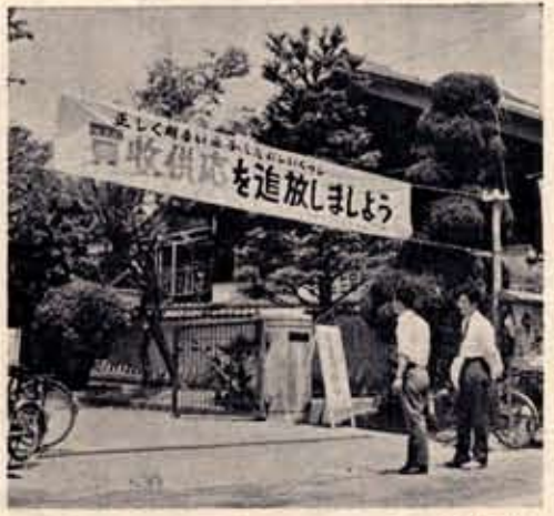
ことしの公明選挙スローガン横断幕

前回より上昇 知事選挙の投票率 四月十一日に行なわれた京都府知事選挙の投票率は五七・一(男五八・二、女五六・一)で、選挙運動のPRの賜も、前回の四六・三を一一・八も上回る成績でした。