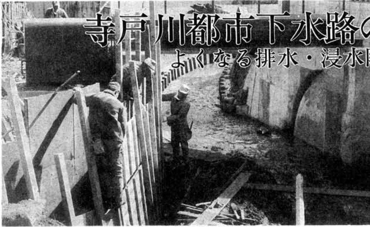
(もうすぐ改修工事が終わる寺戸川都市下水路)

近年の人口の都市集中に伴い、市でも新しい住宅がどんどんふえて いる現状です。 その中で、日常生活に欠くことのできない排水施設は、まだまだ遅れ ています。 市では、市民の暮らしよさを進めるため、都市下水路の整備を急ピ チで進めています。