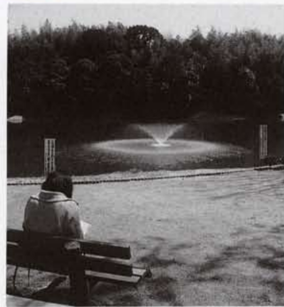
水しぶきがさわやかさを感じさせるひととき

このほど、寺戸町古城にあるはり湖池周辺の整備(当初の3カ年計画)が完了しました。これは、平成元年に策定された西ノ岡丘陵公園整備基本構想に基づき、平成4年度から6年度にかけて取り組んできたもので、整備面積は、約4・6ヘクタールになります。はり湖池・大池周辺からはり湖山を経て芝山公園を回る延長約600メートルの散策道(平成4年度整備)や祠周辺の整備(平成5年度)をはじめ、新たに案内板や公園灯を備えました。また、池には噴水や小橋を