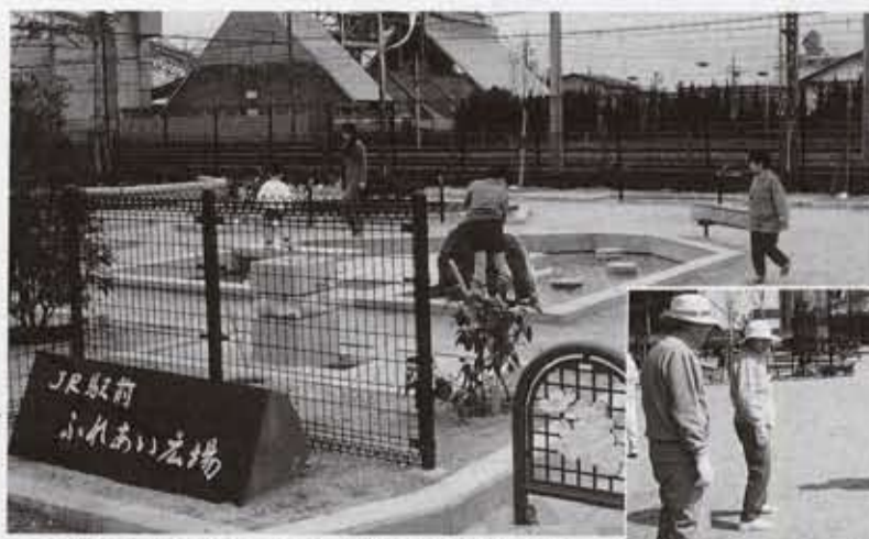
緑と風と水をテーマにした散策路のある公園

ゲートボールやベタタンクなど軽スポーツを楽しめる多目的広場。お問い合わせは、公園緑地課(内線293)へ