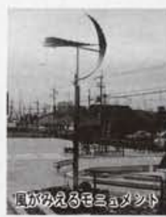
風が吹くモミヨメンド 高さ4m、2枚の羽根が風の力で回ります

JR向日町駅前北側に開設した「JR駅前ふれあい広場」は、市の玄関口にふさわしい景観をもった、子どもからお年寄りまで市民のみなさんがふれあい楽しめる、緑あふれる都市公園となっています。 公園全体の面積は、約1,013平方メートルで、しだれ桜のほか市民の花であるツツジや小さな池などを配した約600平方メートルの散策路とゲートボールやベタタンクなどの軽スポーツのできる約400平方メートルの多目的広場を備えています。