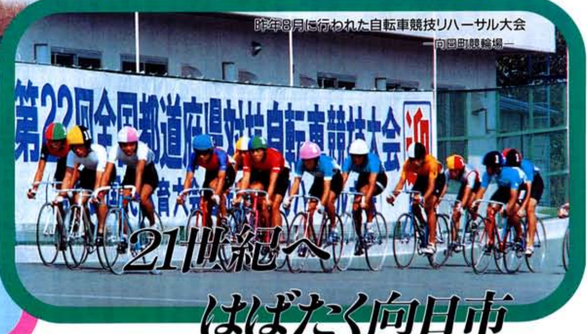
昨年8月に行われた自転車競技リハーサル大会 向日町競輪場