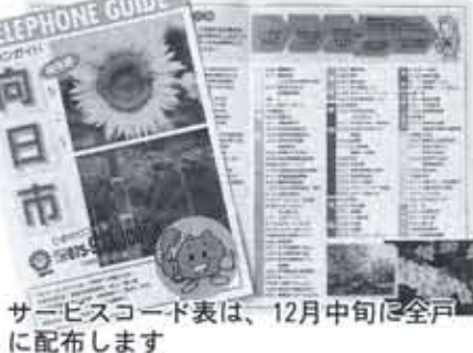
サービスコード表は、12月中旬に全戸に配布します

は、サービスコードの後に0をダイヤルしスタートボタンを押すと、ファックスから情報が出力されます。情報の内容や利用方法をまとめたサービスコード表は町内会などを通じ、12月中旬ごろに各家庭に配布します。詳しくは、秘書広報課(内線240)へ。