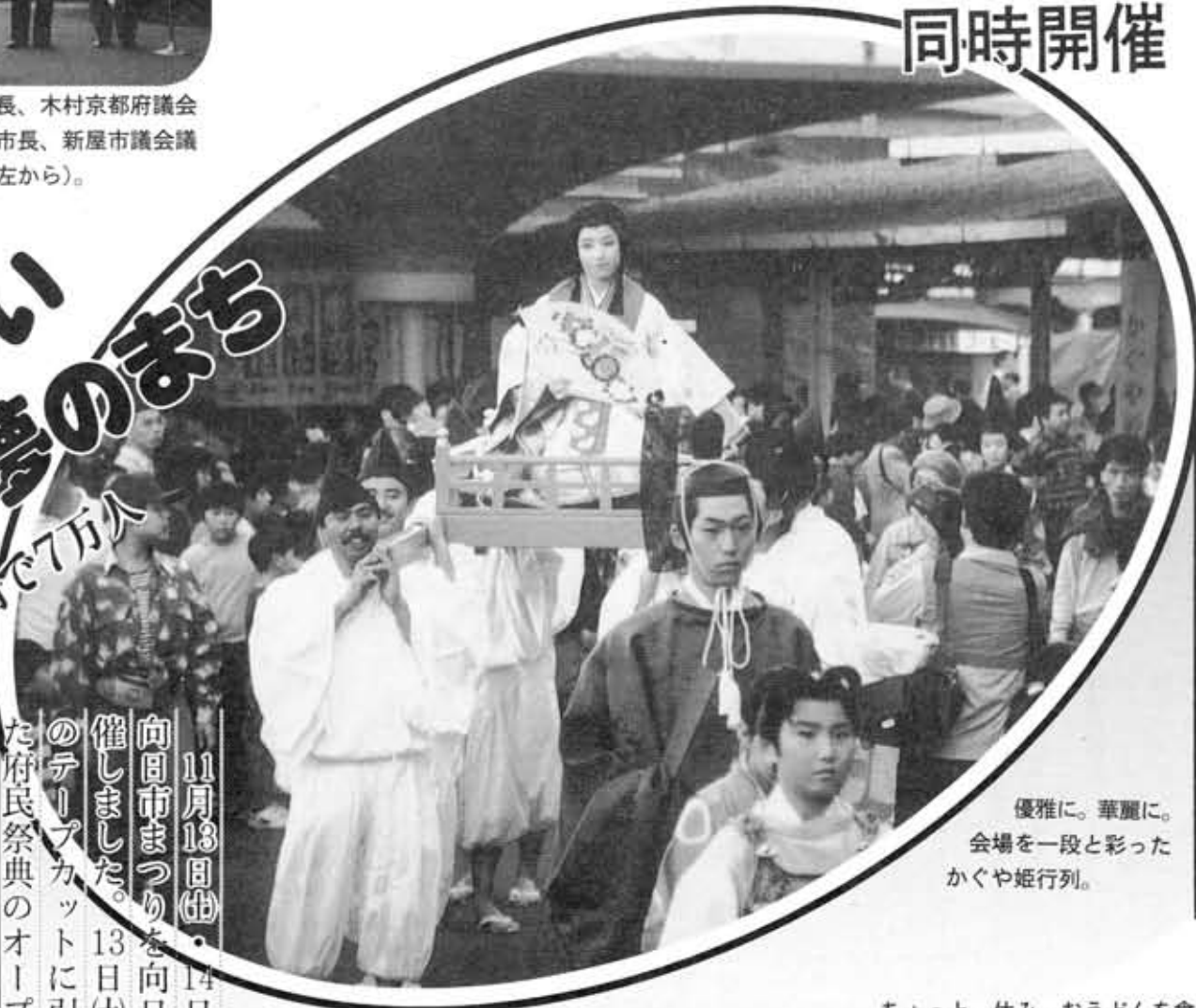
優雅に。華麗に。会場を一段と彩ったかくや姫行列。

11月13日(土)・14日(日)の両日、'93向日市まつりを向日町競輪場で開催しました。13日(土)は、午前10時のテープカットに引き続き行われた府民祭典のオープニングセレモニーが終わるころから降り出した激しい雨にもかかわらず、多くの人々が来場しました。14日(日)は、一転して雲一つない秋晴れに恵まれ、ちびっ子からお年寄りまでが一日中楽しんでいました。 今年で15回目を迎えた向日市まつりは、府民祭典(乙訓)'93との同時開催という相乗効果もあって、2日間で7万人の入場者でにぎわいました。