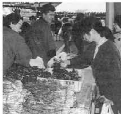
市内でとれた新鮮な野菜はいつも人気の的。栄養もたっぷり、おいしさ抜群。

ちょっと一休み。おうどんを食べようかな。お寿司がいいかな。どれもおいしそうだな。