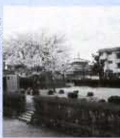
■大極殿公園 1200年以上前の長岡京時代に、天皇が政治を司った大極殿。国の史跡に指定され現在の公園となっている。芝生の上でくつろげる。鶏冠井町大極殿。