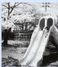
■競輪場タコ公園 競輪場の北東の角にある公園。タコをかたち取った滑り台の遊具は子ども達の人気の的。桜の季節には、親子連れがお昼にお弁当を開けている光景も見られる。