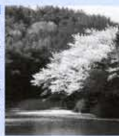
■物業女町主池 府道中山稻荷線が洛西ニュータウンに抜ける竹林の中にある小さな池。水面に映えるサクラと竹林の色合いは素晴らしい。カメラアングルも最高。