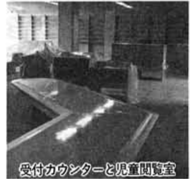
受付カウンターと児童閲覧室