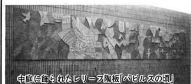
中庭に飾られたレリーフ陶板「バビロンの頃」