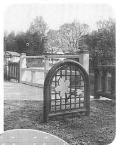
▲散策路を整備したハリコ池周辺 ▲新装した市民会館ホール

久世北茶屋線で総延長858mの築造工事を実施。ハリコ池周辺の散策路を整備。阪急東向日駅周辺地区都