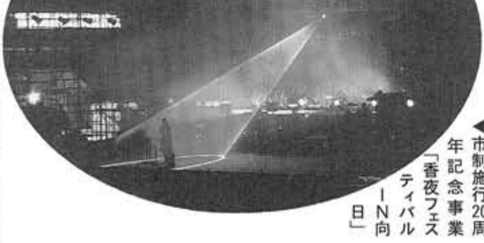
▲市制施行20周年記念事業「香夜フェスティバル」IN向日