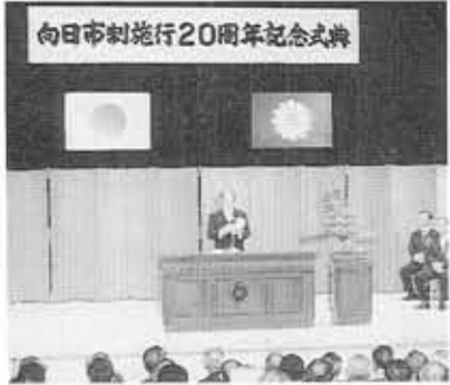
▲市制施行20周年記念式典