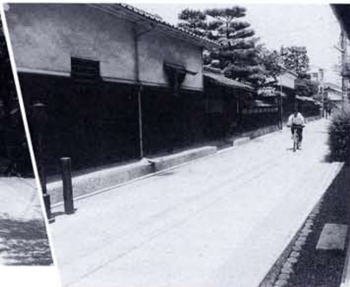
西国街道「歴史の道」上植野町