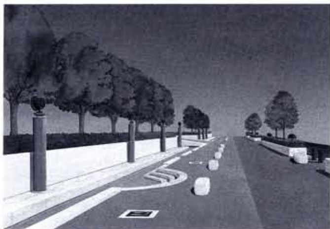
長岡京「東院の道」イメージ図 鶏冠井町