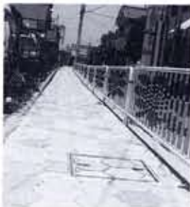
二ノ坪のカラー舗装