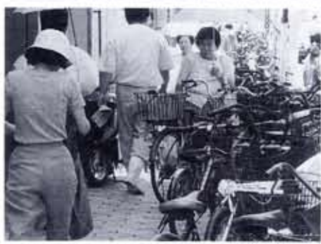
自転車のすき間をすり抜ける通行人