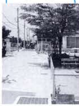
物集女公民館西側カラー舗装