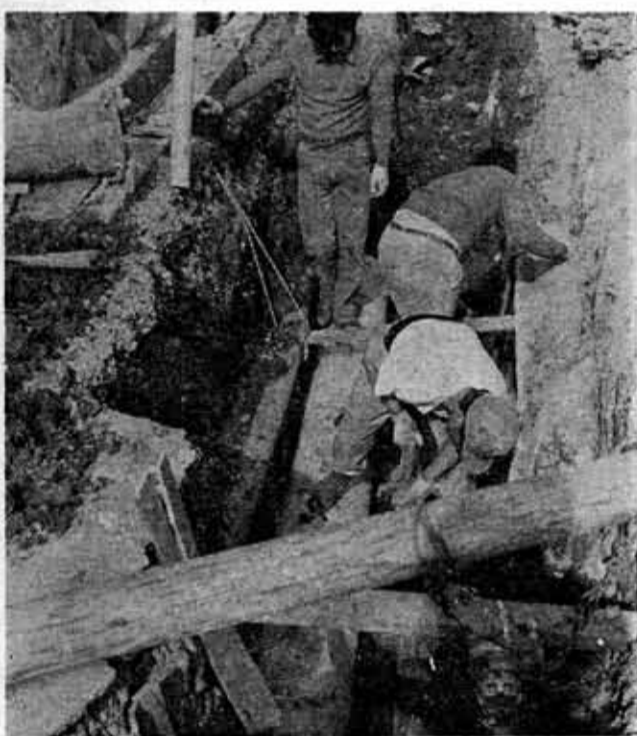
(配水管ふ設も85,473メートルに延びました)

わたくしたちが、なに四万三千三百五十四人、給水不足となりましたが、早期にげなく毎日使う水は、日水件数一万二千五百二十六常生活にとって欠かせないで、昭和四十七年度末から比べ、給水人口では二千六百四人、給水件数では四百七十七人と比べ一〇・七倍、十三メートルと総延長も延べ、給水人口は現在、は全国的に記録的な過水状況に陥っています。