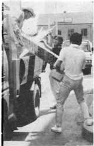
不法物件の撤去作業

8月は「道路を守る月間」です。これは、安全で快適な道路環境を保持し、道路を常に広く、美しく、安全に利用しようという運動です。市では、合同パトロール(8月1日)道路にはみ出した広告物や商品、自転車などの指導、道路占用者合同パトロール(8月1日)水道・下水道・ガス・電気・電話など道路占用者とともに、工事中の保安措置工事終了後の路面などの状況を点検・指導、迷惑駐車パトロール(8月4日)、不法物件(屋外広告物条例違反物件等)の撤去(8月9日)、道路清掃作業(8月11日)、道路パトロール(随時)などを実施して、道路の正しい利用を進めています。また今後、放置自転車指導を8月31日に行う予定です。ご協力ください。