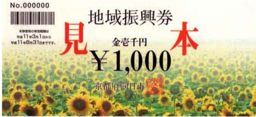
地域振興券の表面