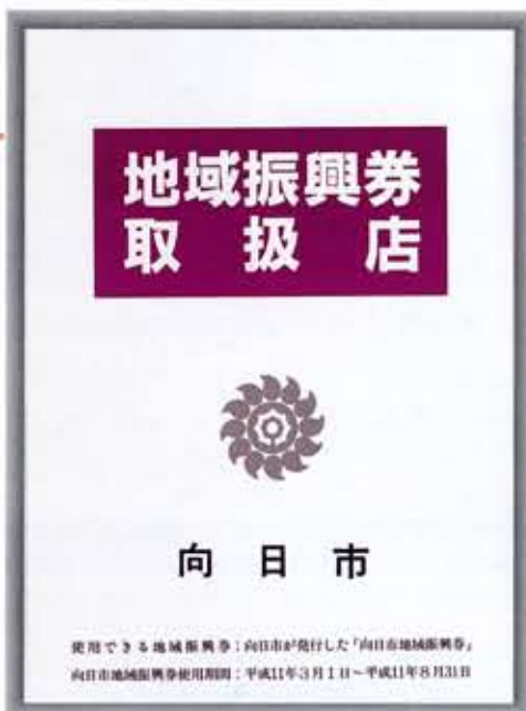
地域振興券取扱店にはこのポスターが表示されています

地域振興券取扱店のポスターは3、4頁に掲載されています。お問い合わせは、地域振興券推進本部(内線510)まで