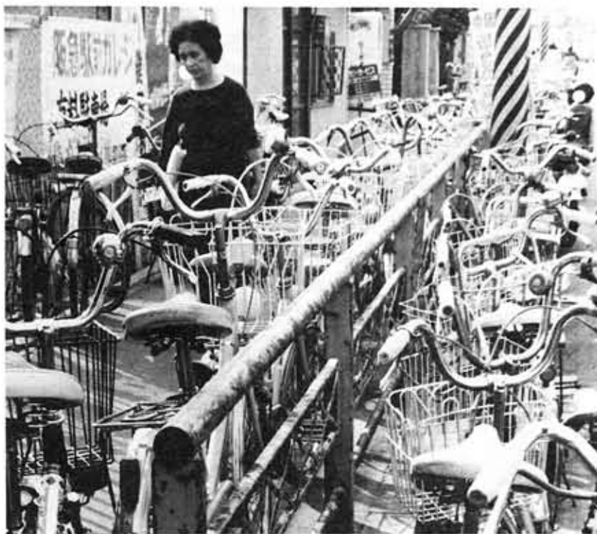
条例施行前の阪急東向日駅周辺

市では、整理区域(特に放置を禁ずる区域)を定めたり、京都市や長岡京市へのPRを行うなどの対策をはじめ、自転車駐車場の少ない大型店舗(スーパーや銀行など)にも駐車場の設 置や整備などの話し合いも行っていますが、一朝一夕には解決できない問題もあります。今後とも腰をすえて撤去や指導などを繰り返して、駅前や道路上から一台の放置自転車