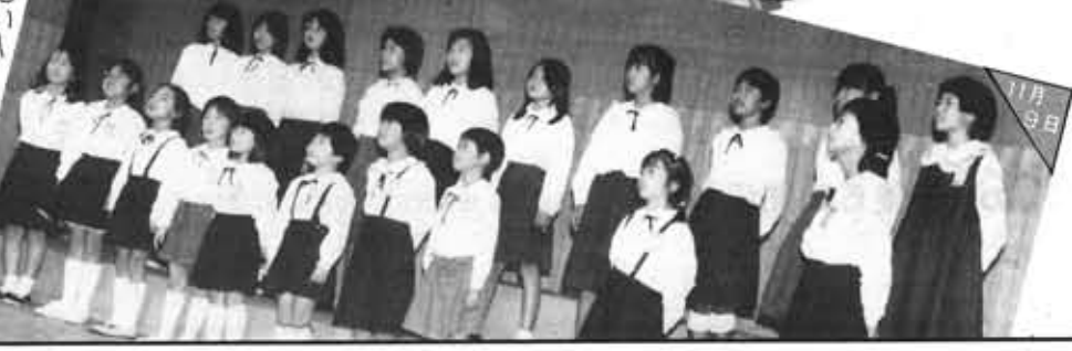
はばたく京都のスポーツ推進大会