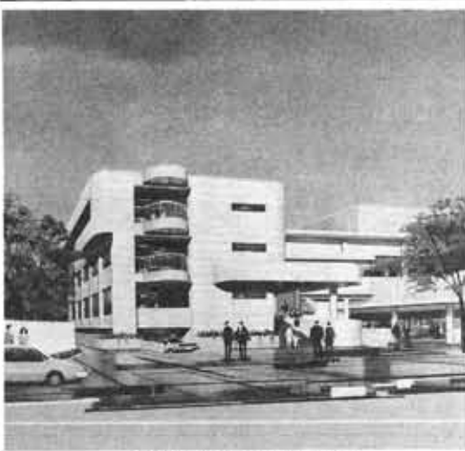
市庁舎増築部の完成予想図

現在の庁舎は、昭和四十五年に建設されたものです。その後の事務事業の増加とそれに伴う職員数の増加によって、手狭になっていきます。そこで、もっとゆとりとしたスペースにし、事務の効率化と執務環境の改善をはかり、また、現在別庁舎の教育委員会事務局を同一場所にして、行政事務の総合性と市民サービス