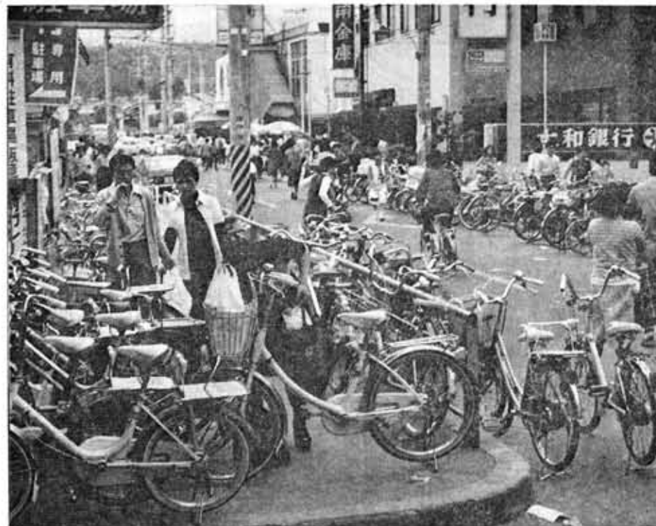
人の迷惑返りみず、ズラリと置かれた不法駐車(阪急東向日駅前)