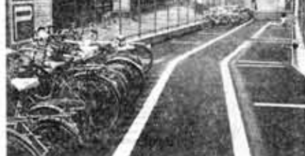
ガラガラの東側置場

さん相互でご注意ください。ようお願いします。 △利用上の注意▽ ◆自転車以外のものは置かないでください。 ◆自転車は、必ずラックに前輪をさしこんでください。 ◆みんなの自転車が出入し入れしやすいように順序よく置いてください。 ◆紙クズやタバコのすいがらなどを捨てないで、清潔にしましょう。 ◆盗難、破損などの責任は一切負いませんので、必ずカギを。また、自転車には、住所、氏名、電話番号を書いてください。 ◆長期間、同じところに置いてある自転車は、処分することがあります。