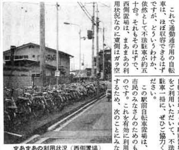
まあまあの利用状況(西側置場)

自転車置場は、駅周辺につくらねばならないという前提をふまえて、用地難、財政難にもかかわらず苦心の末、市が設置した自転車置場は阪急東向日駅をはさんで東西二か所。西側は、寺戸町農家組合などの協力を得て、小畑川を暗きょ化、幅一・七メートル、長さ百八十メートルで、自転車の前輪を固定させるラックを設け、三百五十台収容可能で、工事費は千四百万円。東側は、阪急の敷地を整備。約百八十平方メートルの広さでアスファルト舗装約二百台の収容が可能です。