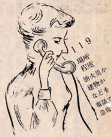
向日町消防団本部

全国の統計から火災の現象について調べてみる。次のようになり、 出火原因については、不始末、から火災を呼びおこしていることがわかる。