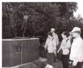
▲平成7年に友好交流10周年を記念して杭州市に贈った「絆」像を見学

今年で12回目を迎えた西湖マラソンには、杭州市が姉妹都市などの縁組みをしている外国から200人がエントリーし、地元選手を含め約1000人が汗ばむほどの陽気の中、風光明媚な西湖畔を駆け抜けました。