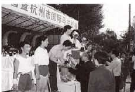
▲入賞者にトロフィーを授与する向日市代表団団長の眞向日市体育協会会長