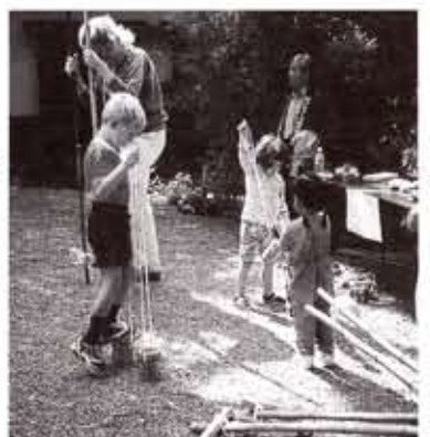
▲箱根ガーデンで開かれたミニ向日市まつりは子供達の人気を呼んだ