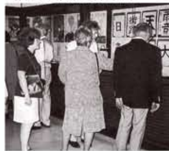
▼箱根ガーデンの展示室には、向日市の子供達が書いた書画や障害者の方の作品が展示された