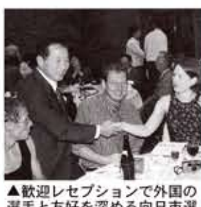
▲歓迎レセプションで外国の選手と友好を深める向日市選手