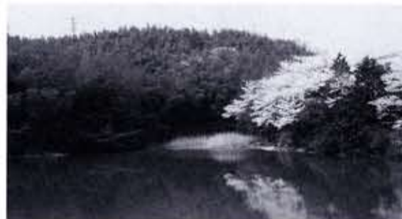
主池(物集女町長野)