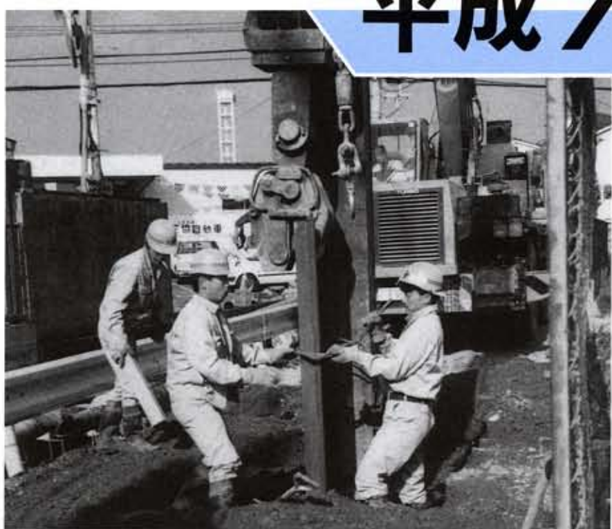
着々と進む下水道工事

文化のバロメーターとも言われる公共下水道は、環境を守り、快適で文化的な生活を営むためには大きな役割を果たす不可欠の施設です。 欧米諸国では古くから下水道の整備に取り組み、その普及率は大変高くなっていますが、我が国の下水道の整備は立ち遅れの傾向がありました。 住み良い生活環境と文化の香り高いまちづくりを目指す向日市では昭和50年3月から公共下水道の整備に積極的にとりかかりました。そして、平成7年度末には下水道の整備は概ね全域に及び、いよいよ仕上げの段階にはいります。 しかし、多額の費用をかけた施設も活用されなければ意味がありません。美しい環境を守るためにも、公共下水道が使えるようになった地域の皆さんには、一日でも早くこの施設を利用していただきますようお願いいたします。 向日市の公共下水道整備事業は、京都府の桂川右岸流域下水道の関連公共下水道として、昭和49年度に森本町で「北向日1号汚水幹線」の工事に着手しました。以後、現在までに各幹線の整備を推進しながら、直接家庭につながる枝線の整備を進め、平成6年度末には整備面積が581ヘクタールに達して市民の皆様