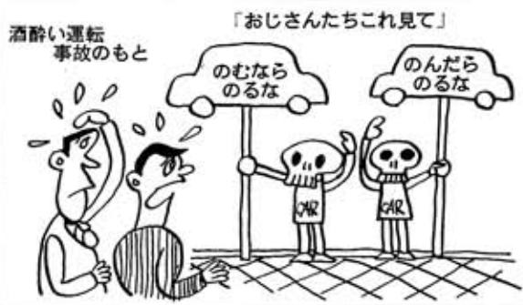
「おじさんたちこれ見て」

転は絶対にやめましょう。ちょっと一杯という軽い気持ちが大きな事故を起こします。 ◎飲みません、車を車庫にしまうまで ◎飲酒運転を追放しよう ◎一杯の酒は一生涯の眠りへ