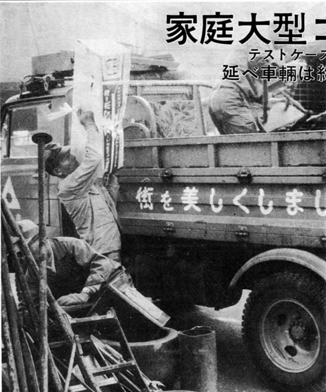
(大型ゴミを手分けしてトラックに積む)

毎日、家庭生活からはきだされるゴミは、生活様式の向上に伴って、多様化してきています。市ではこれに対処し、暮らしの環境をととのえ、清潔なまちづくり事業の一環に、大型ゴミの無料収集をテストケースとし、モデル地区制で、十一月十四日から十六日までの三日間、実施しました。 最近、市でも一般家庭が十年たっている地区を、Aから排出されるゴミも大型化地区(向日台、寺戸町大牧)してきています。テレビ、芝山、千二百七十七世帯、冷蔵庫、洗たく機、机、タB地区(寺戸町爪生・飛竜)山繩手・西田中瀬、千四十三世帯、C地区(寺戸町)三枚田・岸ノ下、森本町上二枚田・下森本、千八百八十五世帯)の三地区(計三千三百五十五世帯)にわけ、収集しました。 午前八時三十分、車輛(二トン積み)四台が市役所を出発、収集対象地区の所を回りました。不燃物ゴミ(ガラ)集積場を回りました。 周知が徹底しているのか、集積場所には、家庭生活から出るテレビ、タンス、自転車、乳母車などが、うず高く積まれていました。さっそうと環境衛生課職員たちが手分けし、トラックに積み込み、大山崎町にある乙訓環境衛生組合のゴミ処理場に持って行きました。 大型ゴミの収集は、三日間を通して、延べ出動車輛約四十台、およそ九〇トンのゴミを集めました。ゴミは、当初思っていたよりも少なく、これは事前に廃品業者が回収したためです。 こんどの大型ゴミの無料収集は、テストケースとして、向日市全域にわたって、定期的の実施していきたいと、環境衛生課ではいっています。 市では、暮らしの環境を