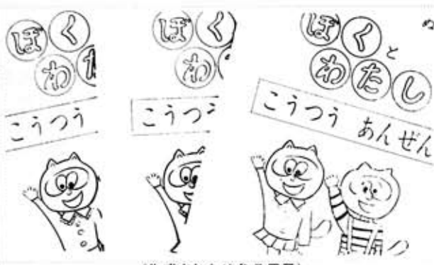
(作成されためりえ冊子)

正しい交通安全知識は幼児から、公害課では交通安全めりえ冊子を、このほど作成しました。 この冊子は、B五判十ページで、「ぼくとわたしのこうつうあんぜん」という題で、めりえとして三千部を印刷、福祉事務所の協力を得て、市内各保育所に配布しました。 めりえの内容は、信号のあお、あか、きいろ、ぬり、横断の方法や渡り方、また道路の幅、いであり、ぬりつ この冊子は、市内各保育所のほか、保健所の三歳児検診や就学児前の検診のときに配布し、自宅で交通安全の基本を、楽しみながら覚えられするように利用、作成されたものです。 また、さらに交通安全実施計画に基づき、交通安全知識の普及として、小学生一・六年生を対象に作成された、「交通安全」副読本に引き続いて、幼児の交通安全に役立ていきます。 公害課では、さる九月、市内各保育所で、母子合同の交通安全教室を開きました。保育所の性格から、保護者の出席者が少なかつたため、保護者もあわせて交通安全の正しい知識を身につけられるという事で、作成しました。 このめりえ冊子ですと、幼ない子にも、楽しみながら覚えて、親子ともに利用していただけるので、と公害課ではいっています。