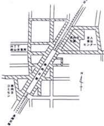
阪急西向日駅周辺整理区域