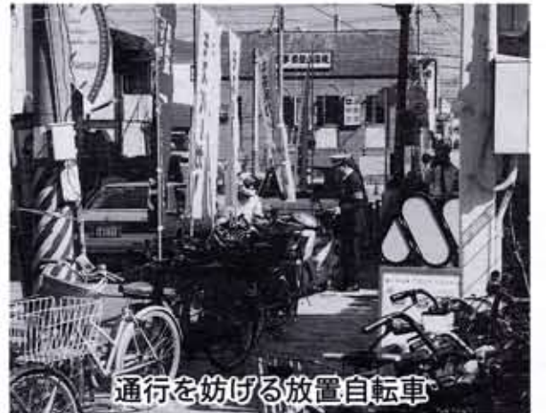
通行を妨げる放置自転車

ちよつとそこまで、気軽に買い物、近くの駅までの通勤手段など、手軽に利用できる自転車は大変便利な乗り物です。目的のすぐそばまで乗ったままで行けることも魅力の一つです。 でも、便利だからといってどこに置いてもいいという訳ではありません。歩道や車道、ちよつとした空間に止めてある放置自転車は歩行者の通行の妨げになるばかりでなく、消防車や救急車などの緊急自動車の障害にもなり市民生活の安全にも支障をきたします。さらには景観をそこねたりします。 道路はみんなのもので、広くゆとりをもつて快適にしたいものです。広くゆとりをもつて通行の妨げとなる放置自転車を無くすため、歩いて十分に用が足せる距離なら、健康増進を兼ねて歩いてみられてはいかがでしょう。 市では、自転車整理区域内の歩道上に放置された自転車を向日市自転車条例に基づき定期的に撤去作業を行っています。 10月17日には阪急東向日駅周辺で歩行者の通行の妨げとなる放置自転車やバイクの撤去を行いました。今回の作業では向日町警察署が放置バイクに道路交通法の適用を行い所有者に自覚を促しました。撤去された放置自転車は約140台で、駐車違反として取締りの対象になったバイクは20台を数えました。 その結果写真に見られるように、歩道が広くすっきりとなりました。歩道や車道に自転車などを止められる方は「私一人くらいなら」とか「ほんの少しだけだから大丈夫だろう」と考へておられる方もあります。それがきっかけになってあつたという間に自転車の列ができるところもあります。自転車やバイクは所定の場所に駐輪されるようお願いいたします。 しかし、一方で、自転車置場の収容能力に限度があるこ