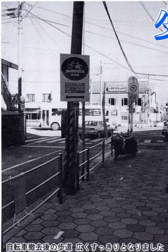
自転車撤去後の歩道 広くすっきりとなりました