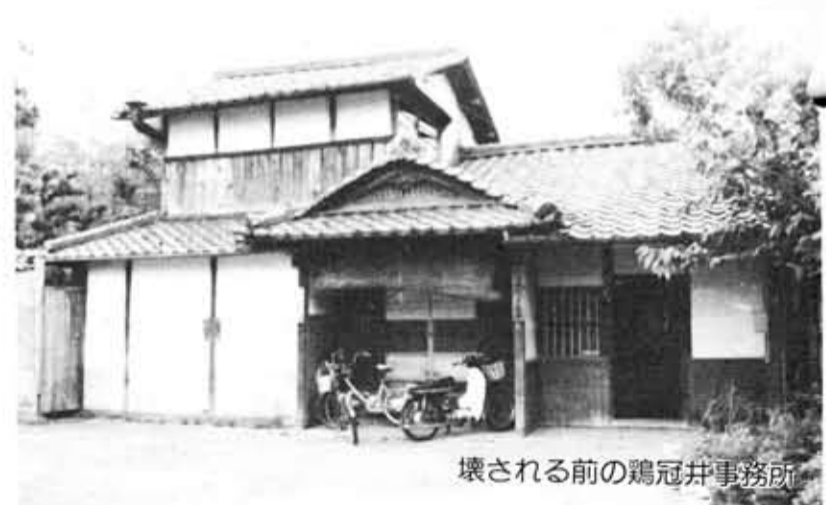
壊される前の鶏冠井事務所