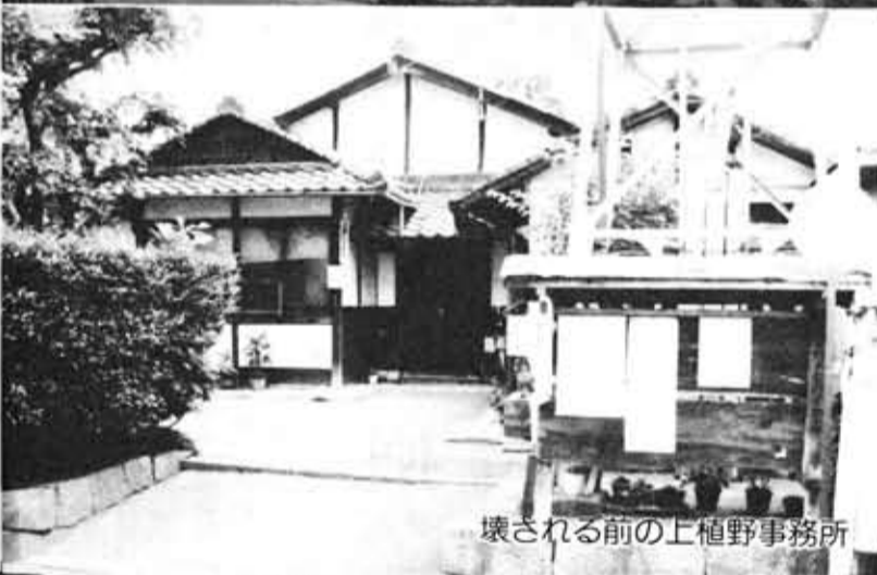
壊される前の上植野事務所

上植野公民館 鉄筋コンクリート造り2階建て、延べ面積は約567平方メートル。 ◆公民館のおもな概要は ▽1階 和室2(8畳・10畳)・研修室(25人収容)資料室・用務員室・事務室 ▽2階 大研修室(100人収容)・会議室(10人収容)