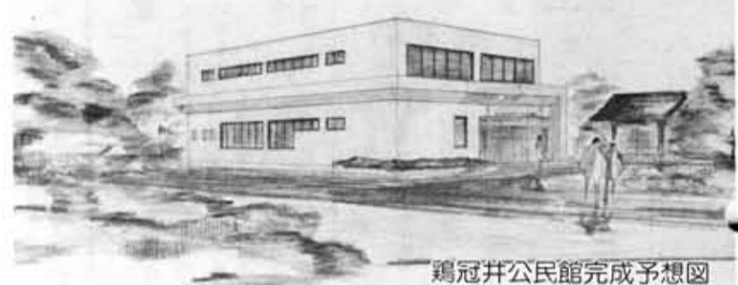
鶏冠井公民館完成予想図

「地域住民のふれあいの場」として、昨年10月から工事に取っかかり、鶏冠井・上植野公民館(建設地は各事務所跡地)は、いま順調に工事が進んでいます。 この両公民館は、地域コミュニケーションの場として、また地域住民の生活文化の振興、地域福祉の増進など、幅広く市民の方に活用されるもので、市では物集女公民館(昭和49年1月オープン)に次ぐものです。 現在、両公民館の建設は、全工程の約50%程度の進捗状況で、3月末完成をめざして、急ピッチで進められています。