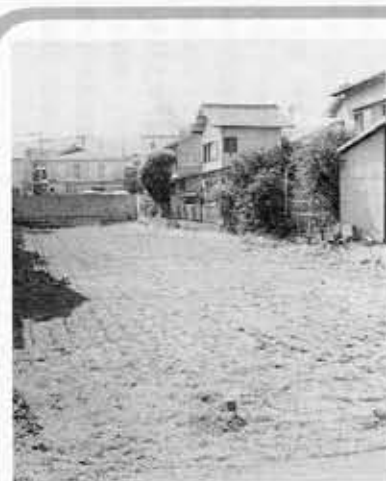
駐輪場建設予定地(寺戸町小佃)

市では、阪急東向日駅周辺の放置自転車対策の一環として、同駅西側(寺戸町小佃)に、550台の自転車を収容できる駐輪場を建設する計画です。この駐輪場が完成すれば東向日駅周辺の自転車収容能力は、1800台あまりとなり、その効果が期待されています。