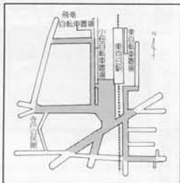
(阪急東向日駅周辺自転車整理区域)