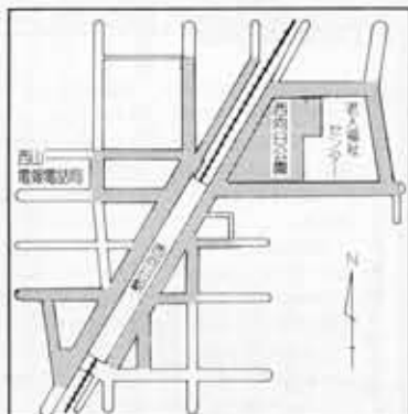
(阪急西向日駅周辺自転車整理区域)