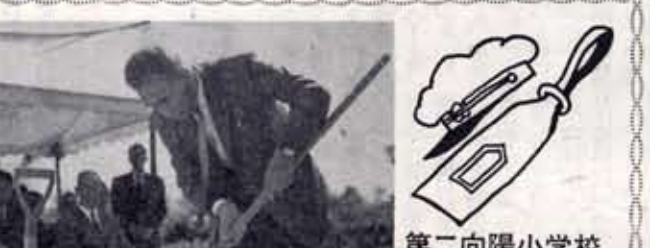
第二向日小学校 地鎮祭

町議会は、町民の生活の安定と向上に必要資金を低利で貸し付ける母子家庭に貸し付け対象は、配偶者のない婦人、二十才未満の子を扶養しているものに、次の資金を貸し付ける。(金額は最高額) 一、事業開始二十万円、事業継続十万円、修学月額千五百円、技能習得月額千五百円、就職支度月額千五百円、住宅増改築十万円、転宅一、二万円