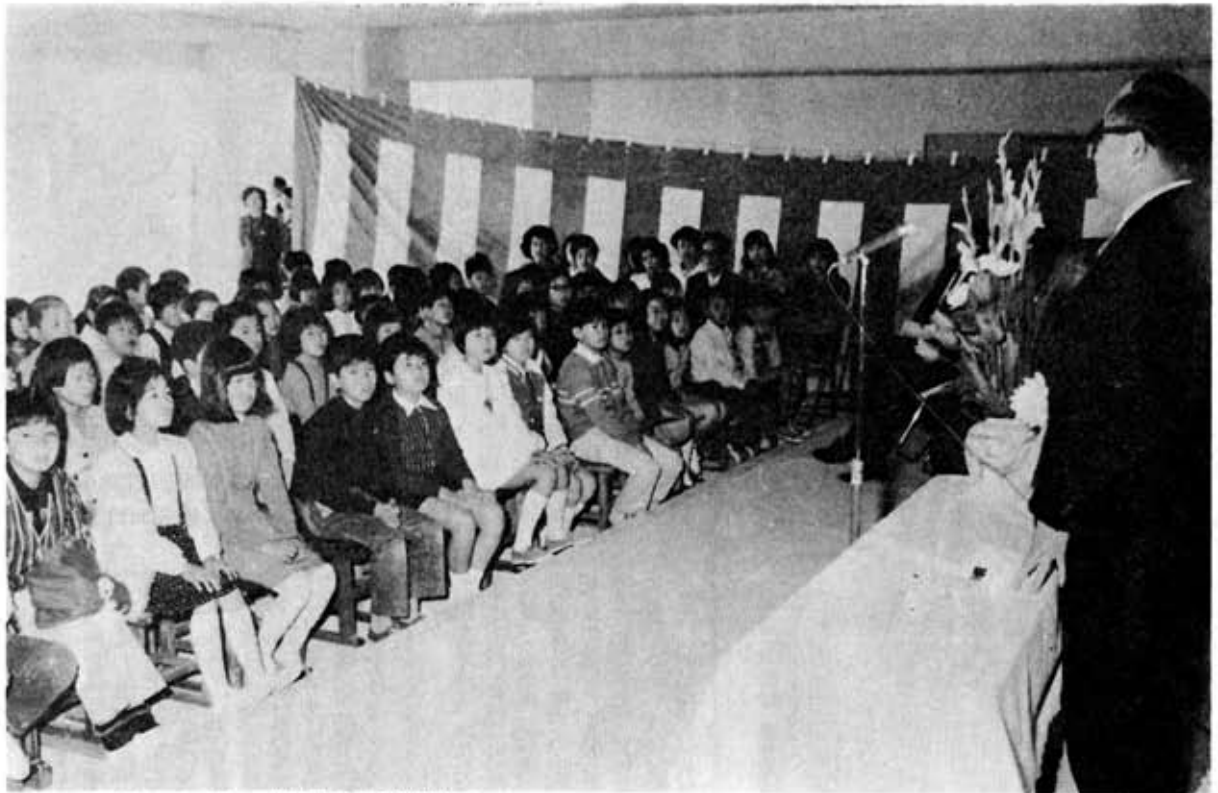
(開校式のもよう=市立第4向陽小学校=)