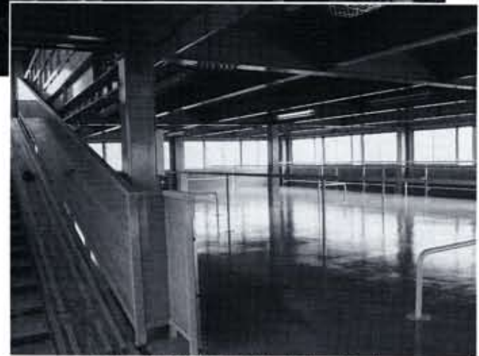
屋内には自転車1,210台が収容できます

※ミニバイクは50cc以下が対象です。 ※身体障害者の方は、月ぎめ契約(定期利用)に限り割引制度があります。