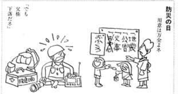
防災の日 用意は万全よネ