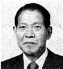
民 秋 市 長