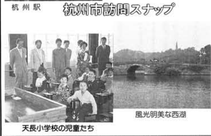
天長小学校の児童たち

向日市・杭州市友好交流協議書 日本国京都府向日市と中華人民共和国浙江省杭州市は、両市の友好交流を増進し、両市民の友好往来を発展させ、文化・教育・産業等の分野において広く交流を行い、両市の発展と繁栄を積極的に促進するため、双方代表が協議し、次のとおり友好交流協議書に調印する。 1 両市は、農業・商業等の視察団を相互に派遣する。 2 市民の書画・作品展覧会を開催する。 3 市民間の各種スポーツの交流を行う。 4 児童・生徒の作文・書道・絵画の作品を交換する。 5 両市は、技術・管理研修生を相互に受け入れる。 6 その他必要な交流事業 この協議書は、日本文と中国文からなり、両市長が署名した日からその効力を発する。 1985年9月27日 向日市・杭州市友好交流協議書全文 この友好交流協議書は、新しい形式として、向日市と杭州市との合意に基づき、調印したものです。