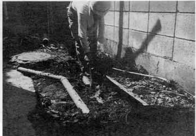
排水設備工事をする住宅

●正副議長 ◎印は委員長、○印は副 委員長、△印は副委員 長です。 ●正副議長 ◎印は委員長、○印は副 委員長、△印は副委員 長です。 ●正副議長 ◎印は委員長、○印は副 委員長、△印は副委員 長です。