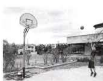
バスケットボール未経験の人も気軽に利用してください

京都バスケットボール協会からバスケットゴールを寄贈 市では、このほど、京都バスケットボール協会から寄贈されたバスケットゴールを市民ふれあい広場(市民体育館南)に設置しました。申込みの必要はなく、どなたでもご利用いただけます。ぜひご利用ください。(ただし、ゲートボールのコートも兼ねているため、ゲートボールの利用が優先されます。)