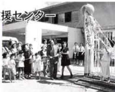
オープンを祝い、岡崎市長とくす玉を割る出席者ら

市内で2番目の子育て支援センター「秋桜」の開所式が8月25日に行われました。この支援センターは、専任の相談員が子育てのいろいろな悩みをお聞きし、具体的なアドバイスをしたり、子育てがいきいきと楽しめるように育児支援を行います。