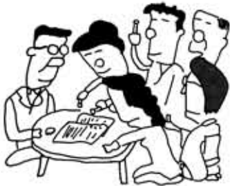
〈建築協定締結の手続〉