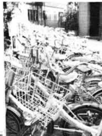
カンパンの前に堂々と放置された自転車(西向日駅前)

お願い 自転車・バイクは自転車置場へ、道路上に放置されずと 当方において移動又は処分します