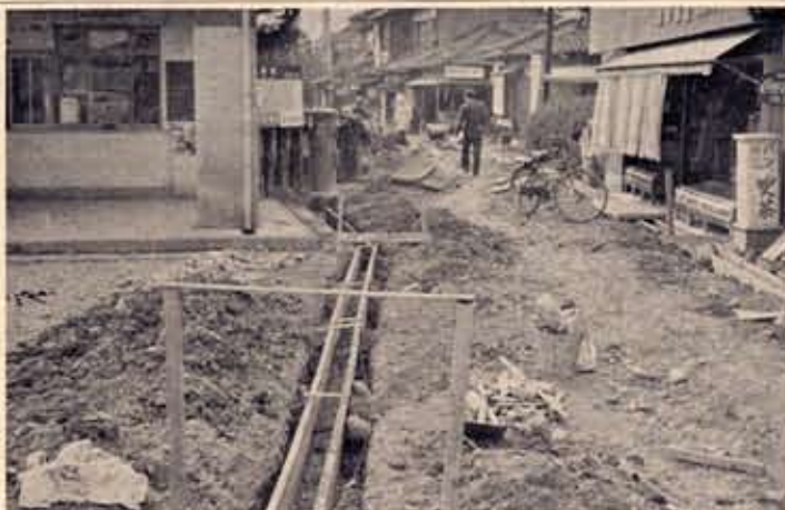
舗装工事中西向日地区

町道のアスファルト舗装は、野を行ない、五センチメートルのアスファルト舗装をするが、郵便局横の舗装のように数日でデコボコ第三弾である西向日地区（阪急西向日町駅付近）の工事は十一月下旬よりかかっている。十二月上旬現在から工事をしているが、この工事がすむといい、地盤がため