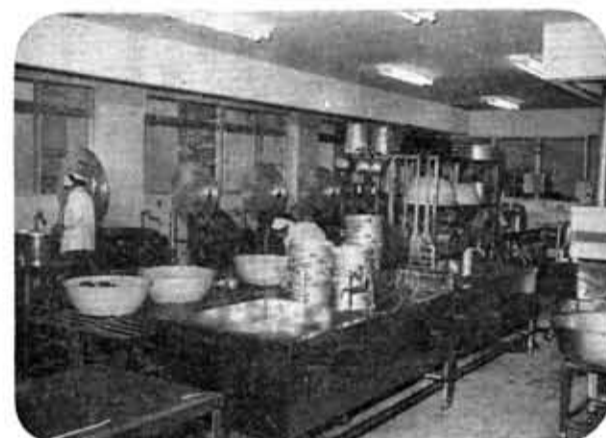
向陽小学校に新しい給食室が…