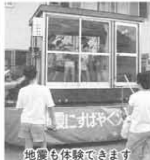
地震も体験できます