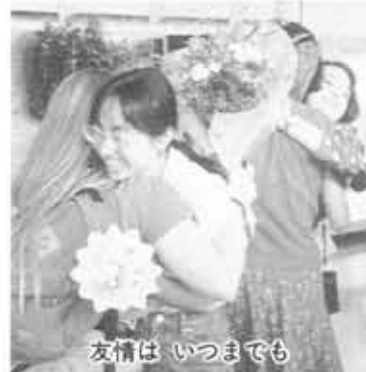
友情は いつまでも