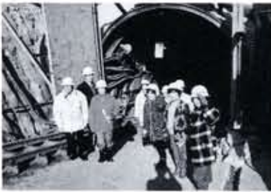
乙訓浄水場を見学するモニター(昨年)