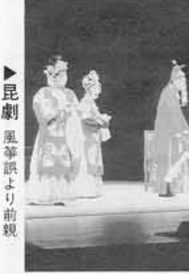
▲昆劇 風箏誤り前親

中国浙江省と本市との友好交流都市・杭州市の合同芸術団が12月3日(日)、京都府長岡京記念文化会館