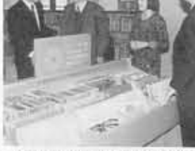
▲図書館・文化資料館を訪問