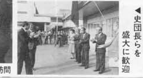
▲史団長らを盛大に歓迎

取益的収支のうち、事業取益は、そのほとんどを占める「給水取益」が、五億一千五百一十二万二千円で、予算現額に対して五一・八％と順調な収入となっています。