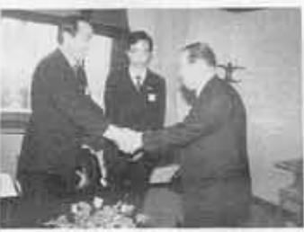
▲史団長と友情の握手

中国浙江省と本市との友好交流都市・杭州市の合同芸術団が12月3日(日)、京都府長岡京記念文化会館