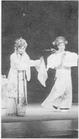
▲昆劇 牡丹亭より遊園・驚夢