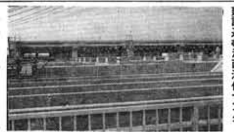
建設進む洛西浄化センター

今まで一般に、道路わきの側溝が下水道と呼ばれていました。これは、道路の雨水を排除するためのもので、公共下水道がないため、家庭から出る汚水を流し、これを利用してトイレなどに使われます。これは、河川が汚れるばかりです。特に人口が集中する都市部では、衛生的で文化的な生活を営むために、下水道は今や必要不可欠なものです。