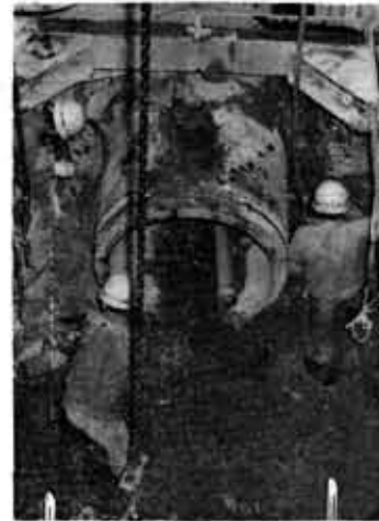
順調に進む下水道工事（森本町）

九月十日は、「全国下水道促進デー」です。これは下水道についてその整備促進を図ろうとする「市民運動の日」です。これを機会に、下水道の働きや、現在の本市の建設状況について話を進めてみましょう。