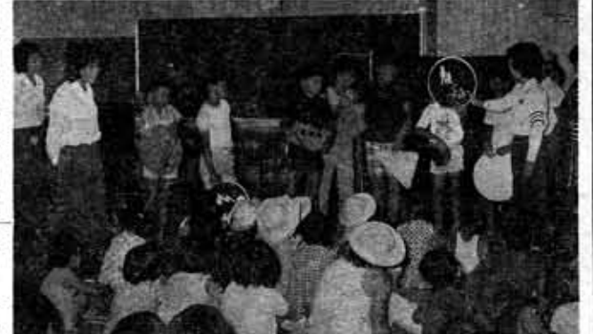
(婦交さんの指導でルールを学ぶ)