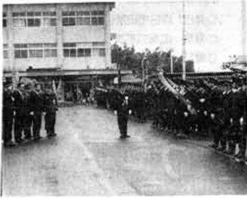
部隊観閲も厳粛そのもの

新春恒例の消防出初め式が、おとそ気分もぬけきらない1月8日、市役所前・競輪場内で行われました。