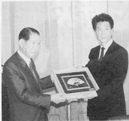
盧市長(右)に友好の記念品を贈る民秋市長

今回の公式訪問は、本市と中国杭州市との間で、昭和60年9月に、友好交流協定が締結されたから初めてのことでした。昨年3月に本市を訪れた呉仁源氏を団長とする杭州府及び人民の願いです。