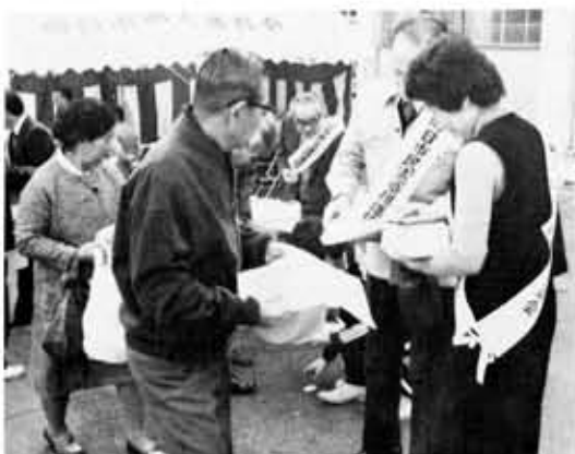
市民憲章街頭P・R (81向日市まつり会場)

市民憲章推進協議会では、昨年十月に「市民憲章」に関するアンケート調査を行いました。その結果がまとまりました。 アンケート調査は、市民のみならず、市民憲章をどのように受けとめ、考えておられるかを知り、今後の普及・啓もう活動に役立てるために行ったものです。 調査対象者は、選挙人名簿から無作為に五百人を選びました。その内、回答があったのは二百七十八人、