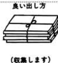
良い出し方 (収集します)

ダンボール(みかん箱など)は、必ずこわして30cm～50cm位の大きさに切り、ポリ袋に入れるか、5cm程度の厚さに束ねて出してください。 なお、ダンボールを束ねてなく、大きい場合は収集しないことがありますのでご注意ください。