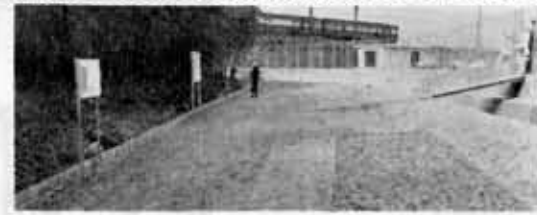
(整備が完成した森本遺跡)

第三小学校の用地内に、先般掘られた弥生時代の遺跡である森本小字下森本の「森本遺跡」が、緑地（しほひ）化され、このほろ整備が完成しました。 この遺跡は、第三小学校グラウンドの用水路沿いにあり、町教委が掘出した土、矢野、土間、石、木炭などを出土、遺跡本体が弥生時代の水田遺構と推定されました。 保存方法は、水田跡の「元板列」(石中に埋め込み)「しほひ」化、説明板三基を立ち、見取、一般人が自由に見学できるようにしています。