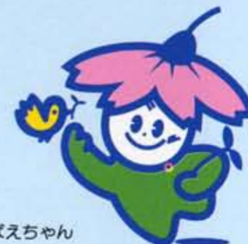
マスコット めばえちゃん

全国都市緑化フェアは「緑ゆたかな潤いのある街づくり」をめざして、毎年開催されている花と緑がいっぱいのイベントで、京都では、平安建都1200年に当たる平成6年秋に開催します。