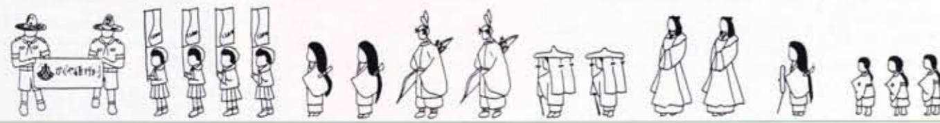
先列隊 ボーイスカウト パナー隊 ガールスカウト 平安建都1200年 キャンペーンレディ 武官(から衣姿) むしの垂れぎぬ(壺装束) 女官(朝服) 市女傘 (壺装束に裡をカブク) 水干の童