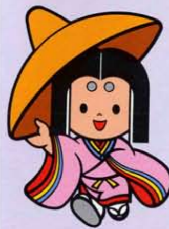
マスコットの「京のぞみちゃん」

1994年(平成6年)、京都は794年(延暦13年)に平安京ができてから1200年目を迎えます。これを記念して、一年間、京都のまち全体を舞台にして、伝統芸能から前衛芸術まで、1200年の文化の蓄積に培われた京都を彩る様々なイベントが展開されます。