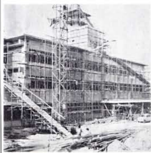
役場新庁舎 順調に工事進む

農業委員会のおもな仕事は、①農地法に基づいて、農地の売買や貸借の調整、宅地転用するなどの土地利用関係の調整の処理、②農家の「暮らし」や「経営」についての問題をとり上げ、農業振興計画を作ったり、けいこう、調査、研究をする、③農業や農家の立場を代表して行政庁へ意見を述べることなど、農民の地位の向上をすすめることです。