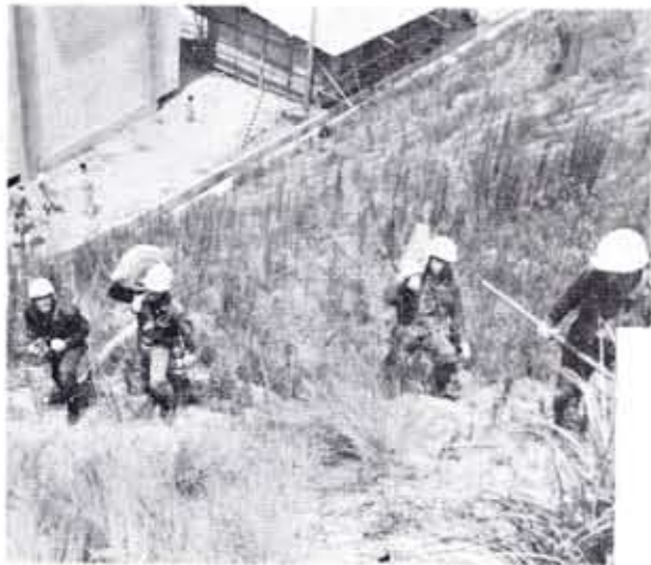
傾斜地での基本操法訓練