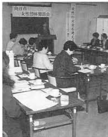
和やかに話がはずむ女性団体のみなさん

市内で活動をしている女性団体の間で、お互いの情報や意見を交換し、連携と相互交流、研修の場となる「女性団体懇話会」を初め